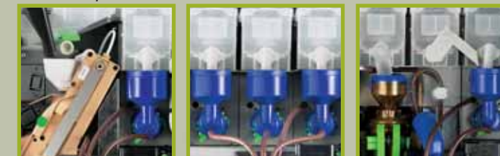
Version Fresh Brew